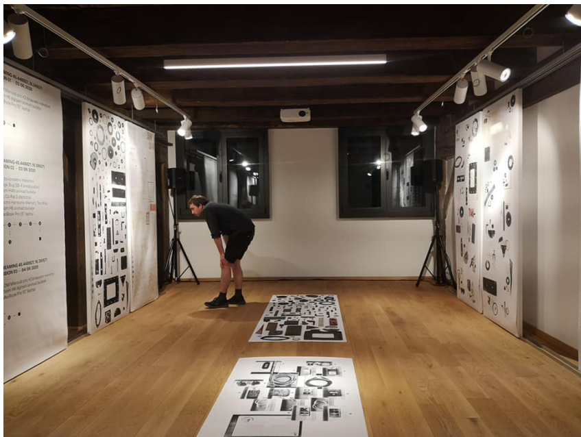
Postav izložbi “ReThink — Behind the scenes” i “Radical Now — Archiving Coordinates” iz 2020. godine